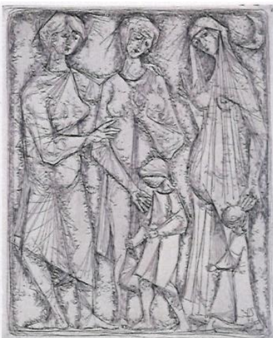
Die Toten begraben 1975 Radierung