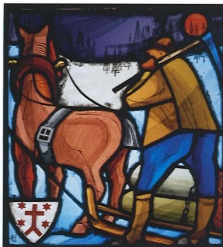
Geschlechterscheiben für das Rathaus Gersau 1966 Fischfang mit Wappen Nigg Ackerbau mit Wappen Niederer

1954 erhält Hans Schilter seinen ersten Auftrag für Glasscheiben für die Kirche des Kapuzinerklosters Schwyz. Es folgen Aufträge für Einzelscheiben, aber auch für umfangreiche Scheibenzyklen für Rathäuser, Kirchen und Kapellen. Diese Technik verlangt vom Künstler die Begabung, eine Bildfläche in einzelne Glasflächen zu gliedern ohne dabei die malerische Wirkung eines Bildes zu verlieren. Die gegenseitige Beeinflussung von Schilters Landschaftsmalerei und seinen Entwürfen von Glasbildern ist durch die klare Gliederung der Bildfläche evident. Die Stifterwappen, in Scheiben aus vergangenen Jahrhunderten prominent ins Zentrum gerückt, werden bei Schilter zunehmend zur gestalterischen Nebensache.