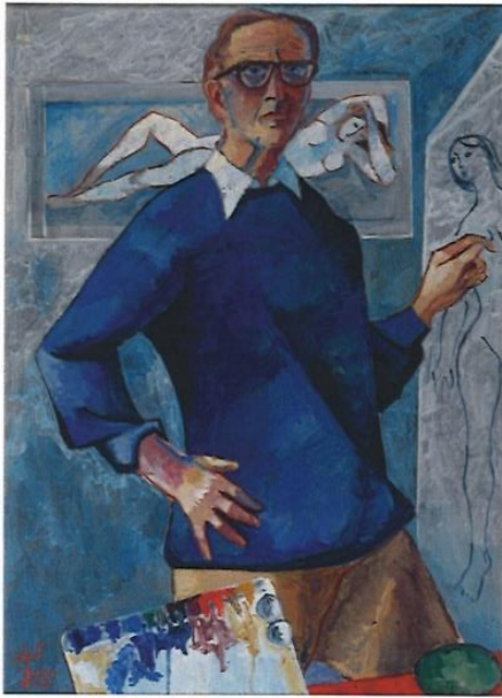
Bildnis des 64-Jährigen 1981/82 Öl auf Leinwand